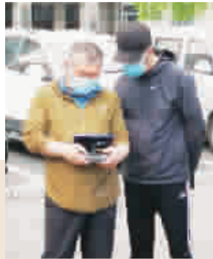
用无人机寻找巢穴